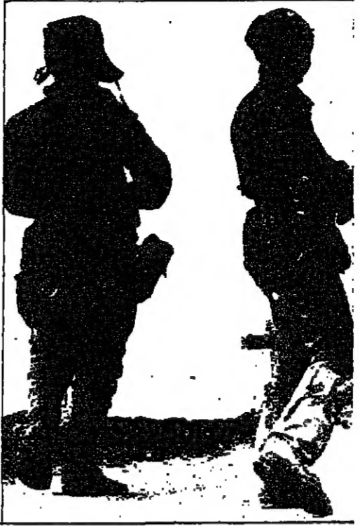
دورية سوفياتية على طريق جبلي منزول بالقرب من العاصمة الأفغانية كابل